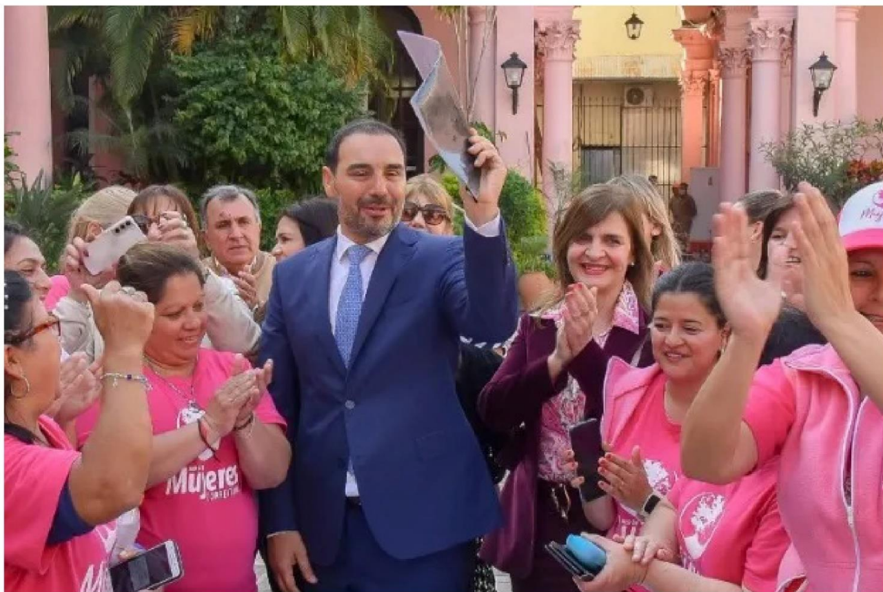
APROBACIÓN DE LA LEY DE PARIDAD DE GÉNERO