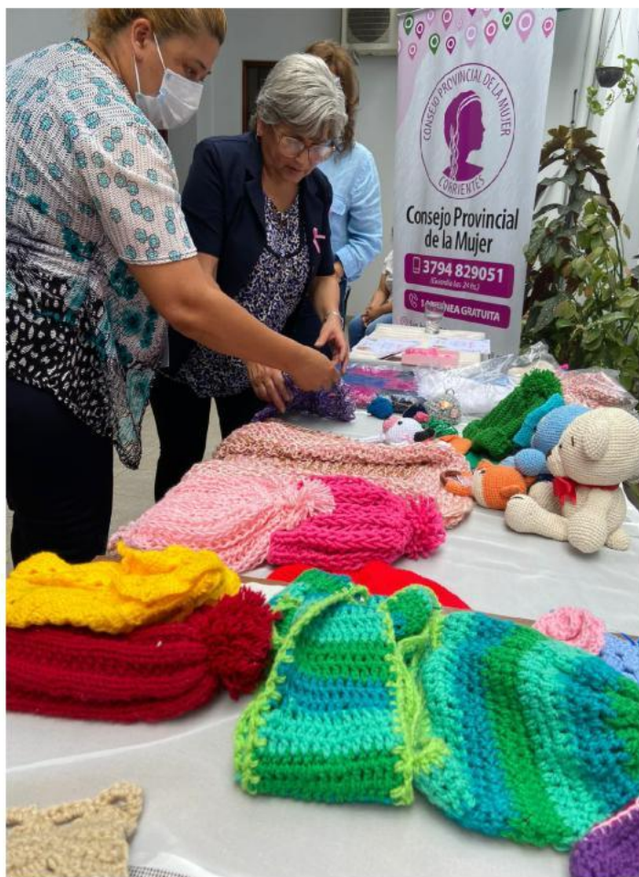
TALLERES PARA MUJERES