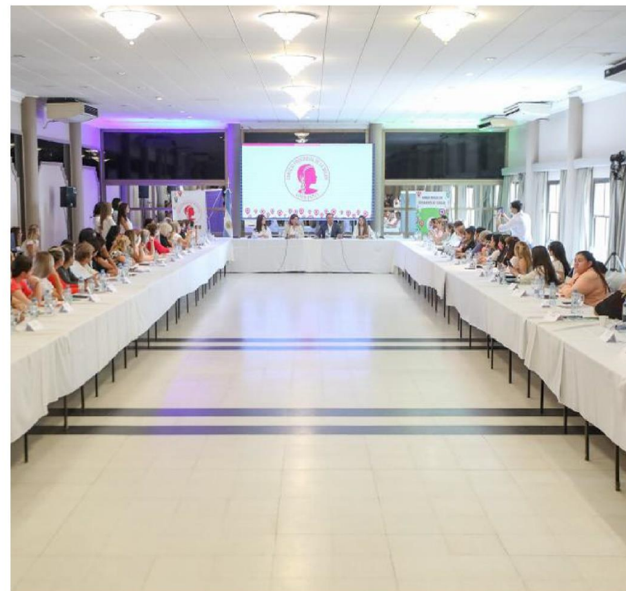
PRIMER ENCUENTRO DE ÁREA MUJER DE LA PROVINCIA