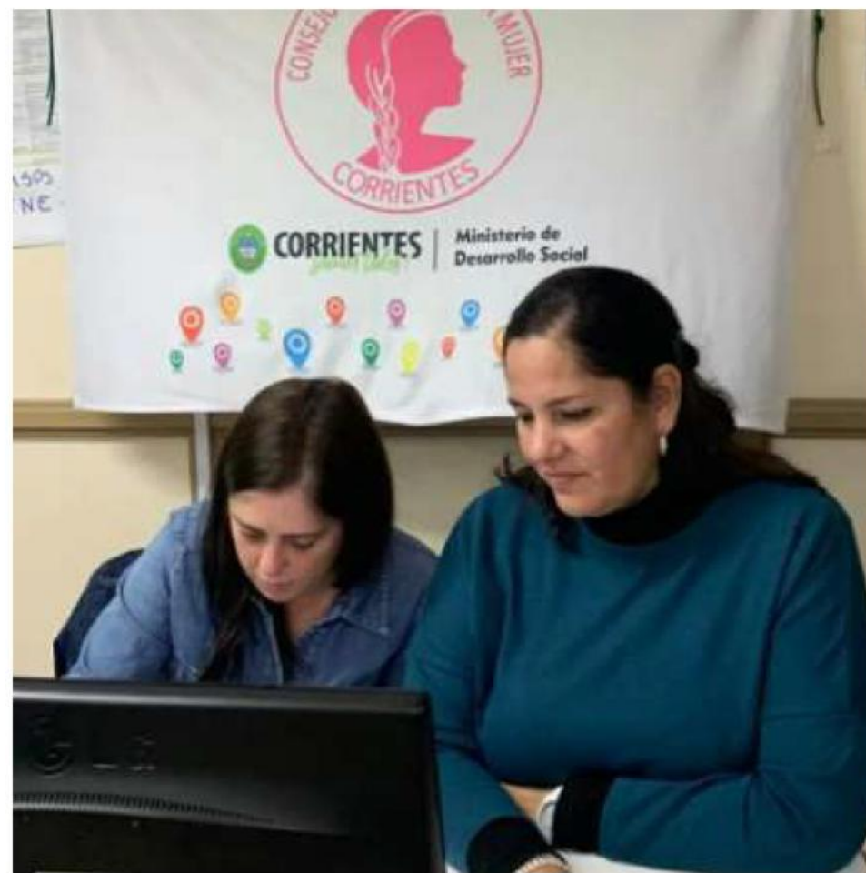
APOYO ECONÓMICO A MUJERES QUE SUFREN VIOLENCIA