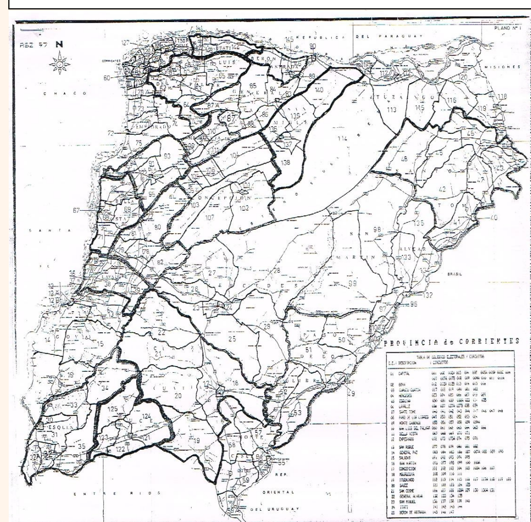
Mapa de Circuitos Electorales